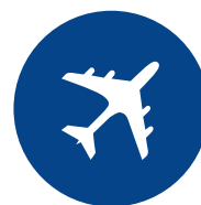
Egészség - turizmus

Eltérő méretű praxisok különböző igényeket támasztanak a praxismenedzsment szoftver felé. A rengeteg teendő mellett nem mindig jut idő tüzetesen megvizsgálni a munkafolyamatokat , azok optimalizálása érdekében. És itt jövünk mi a képbe.